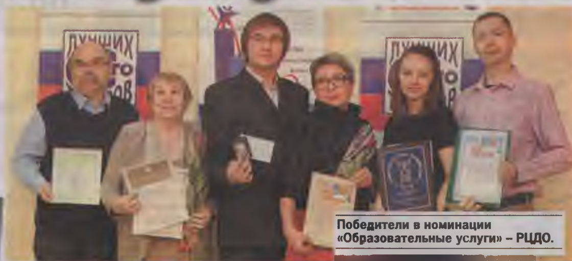
Победители в номинации «Образовательные услуги» – РЦДО.